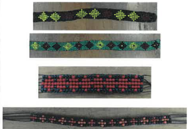
說明：學生就設計圖完成之作品