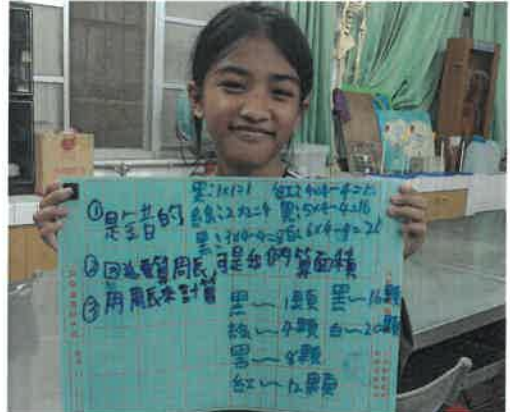
說明：思辨能力訓練